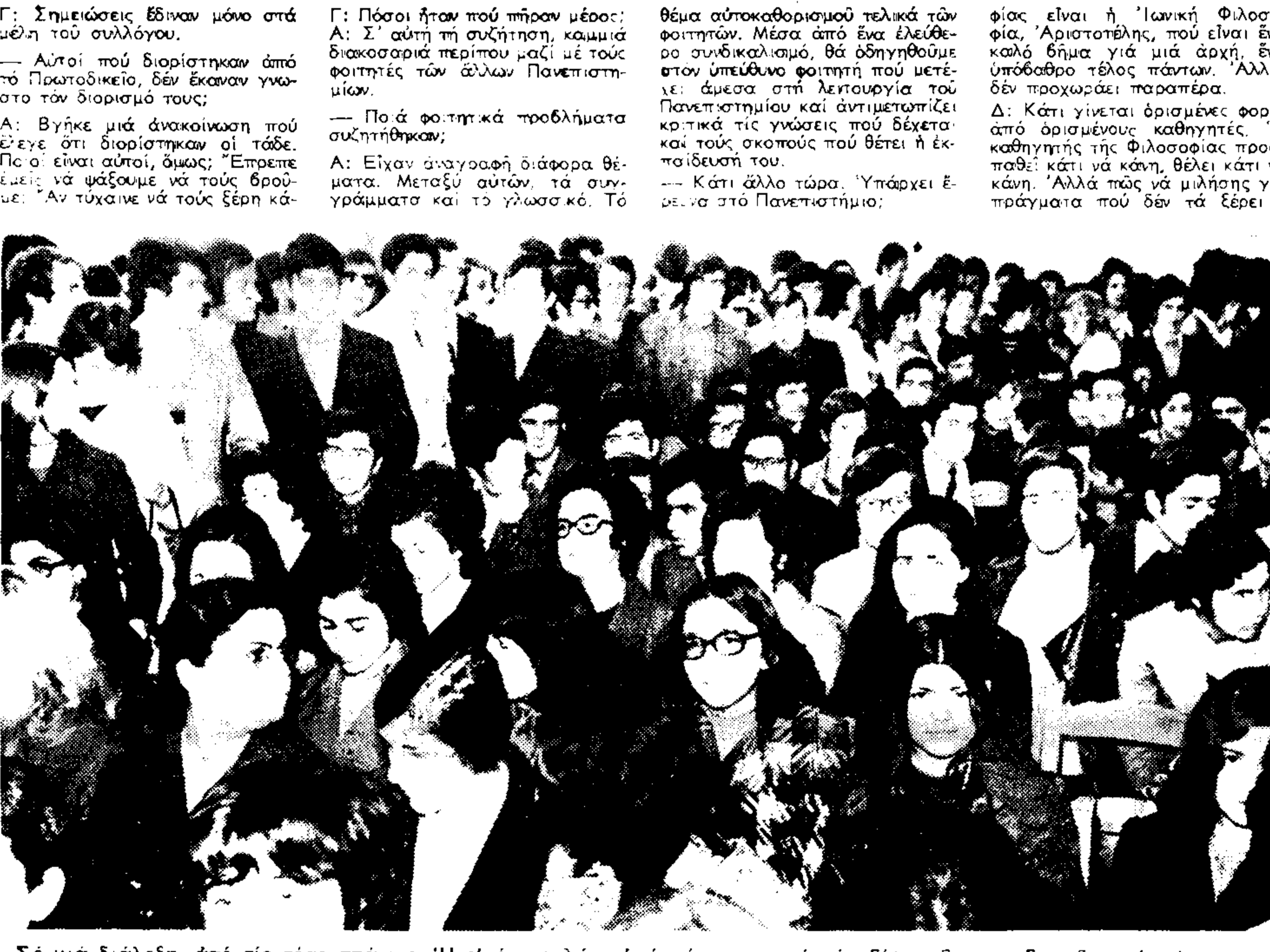
Σέ μία διάλεξη, από τίς τόσο απάνει. Ή είκόνα μιλάει από μόνη τής γιά τήν βίρα των σπουδαστών γιά κάτι περι- ότερο από τά ξέρα μαθήματα